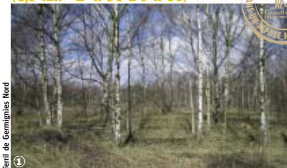
Terril de Germignies Nord